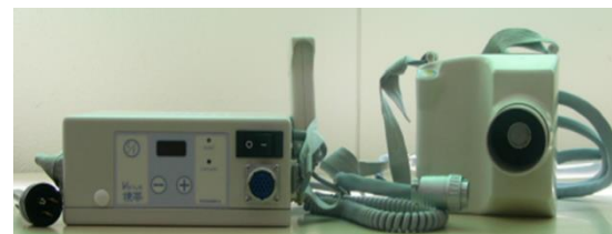
ポータブルレントゲン