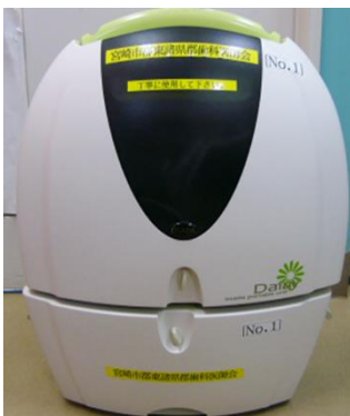
ポータブルユニット

今回は宮崎市郡歯科医師会の医療と介護の連携への取り組みについて紹介させていただきました。今後も事業等を精査しながらコロナ禍の中ではありますが、ICT を利用しながら地域医療の一翼を担えるよう頑張りますのでよろしくお願いいたします。口腔の事でお困りの事があれば宮崎市口腔保健支援センター (Tel.0985-41-4311) へお気軽にご連絡ください。