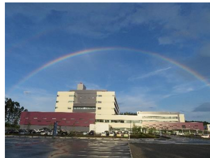
会営薬局からみた宮崎市郡医師会諸施設全景