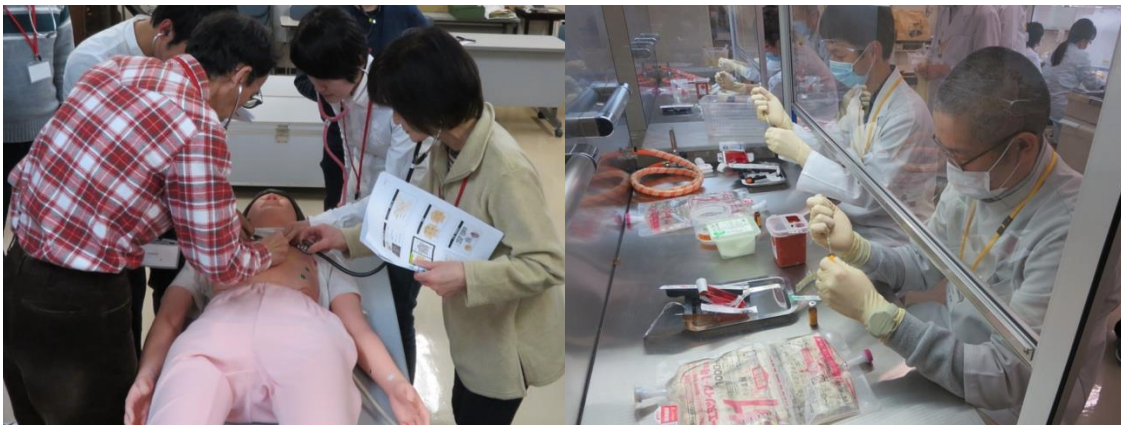
フィジカルアセスメント研修会